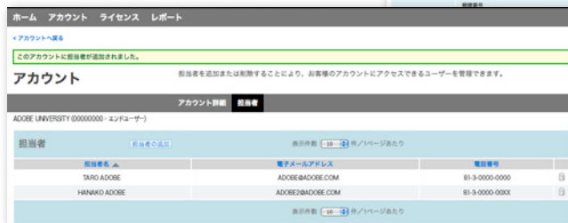
担当者の表示や追加、変更などが行えます