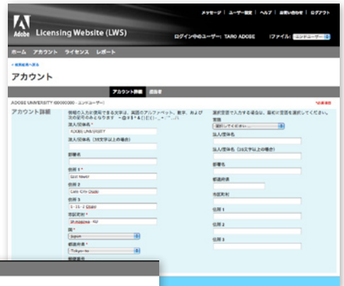
登録情報の確認・変更が行えます

アクセス権限の管理が可能となり、すでにアクセス権がある担当者が他の担当者へアクセス権限を付与することができるようになりました。アクセス権を与えられた担当者は、自身のログインID (Emailアドレス) でLWSにログインできます。なお、CLPのライセンス管理担当者は、エンドユーザー情報を確認・変更できます。